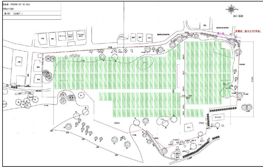
太陽光パネル配置図